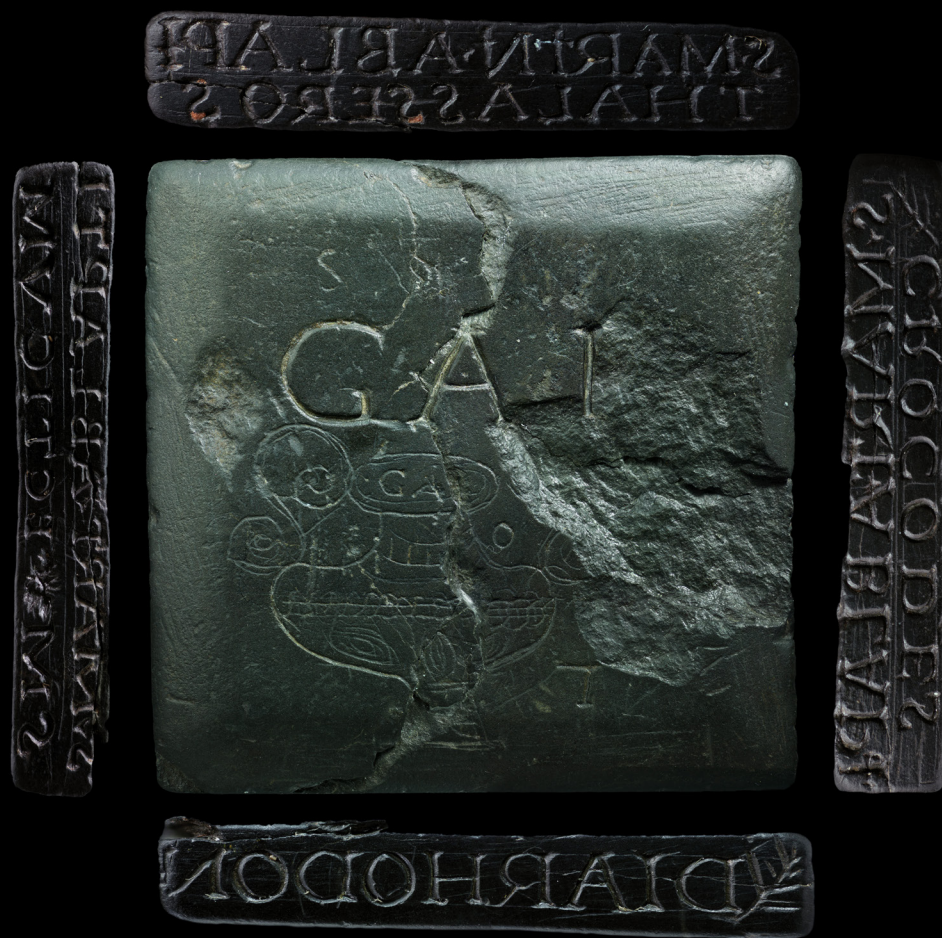
Cachet d'oculiste conservé au Musée archéologique départemental de Vieux-la-Romaine.