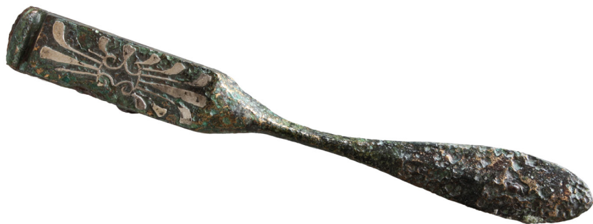
Manche de bistouri, antiquité gallo-romaine du III e siècle après J.-C., conservé au Musée archéologique départemental de Vieux-la-Romaine.