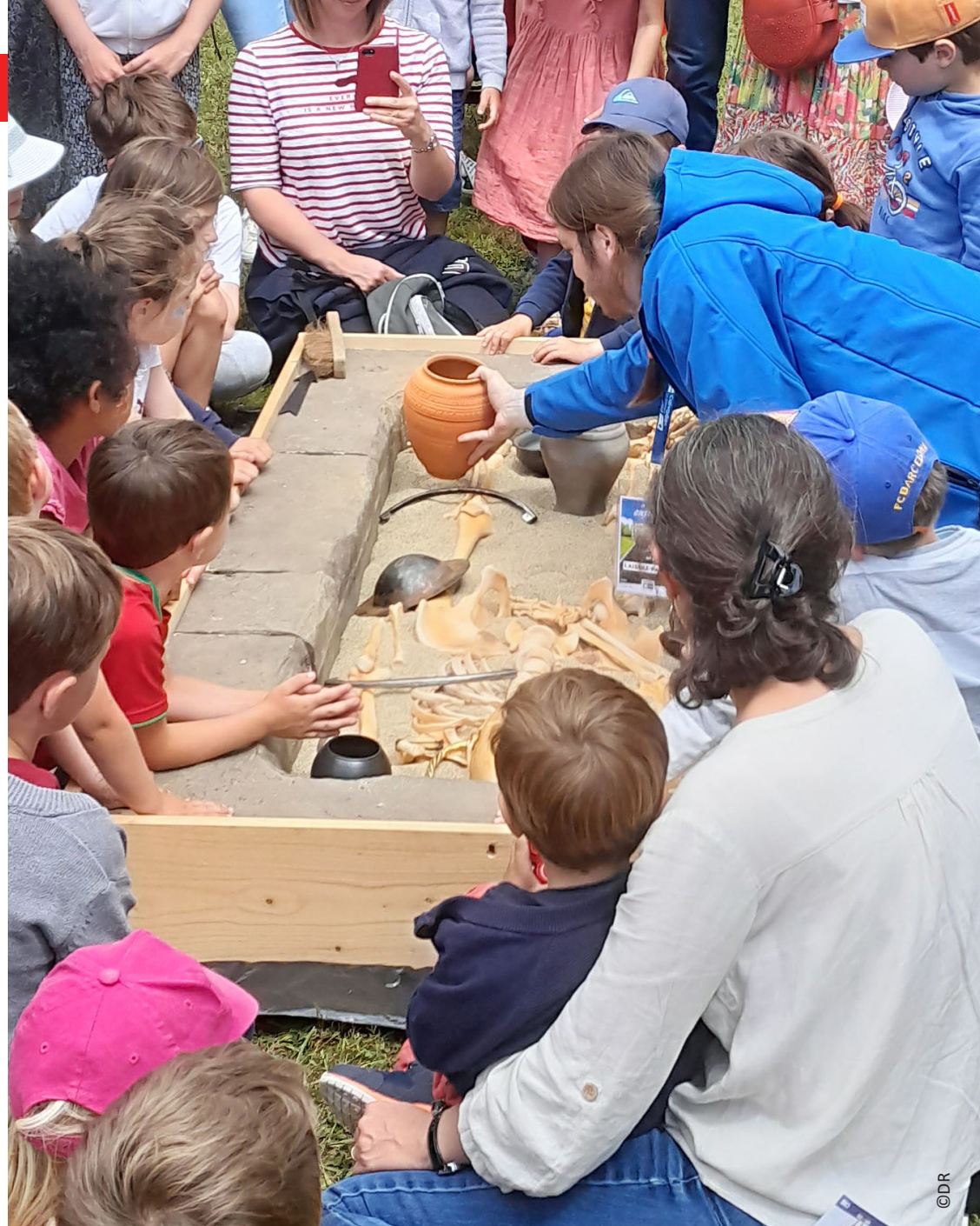
Atelier pédagogique animé par le Service Archéologique du Département du Calvados autour des gestes funéraires (ci-dessus)